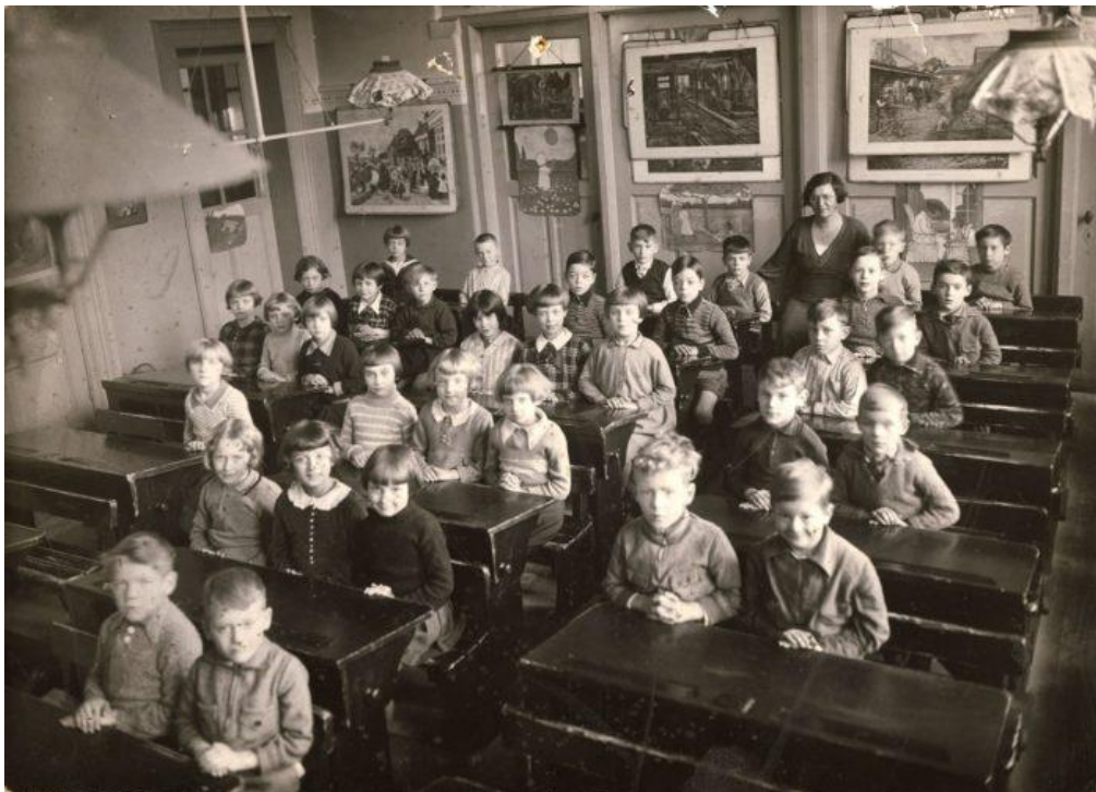
Klassenfoto van een eerste klas (tegenwoordig groep 3), omstreeks 1910

Laat de leerlingen naar de volgende foto kijken.