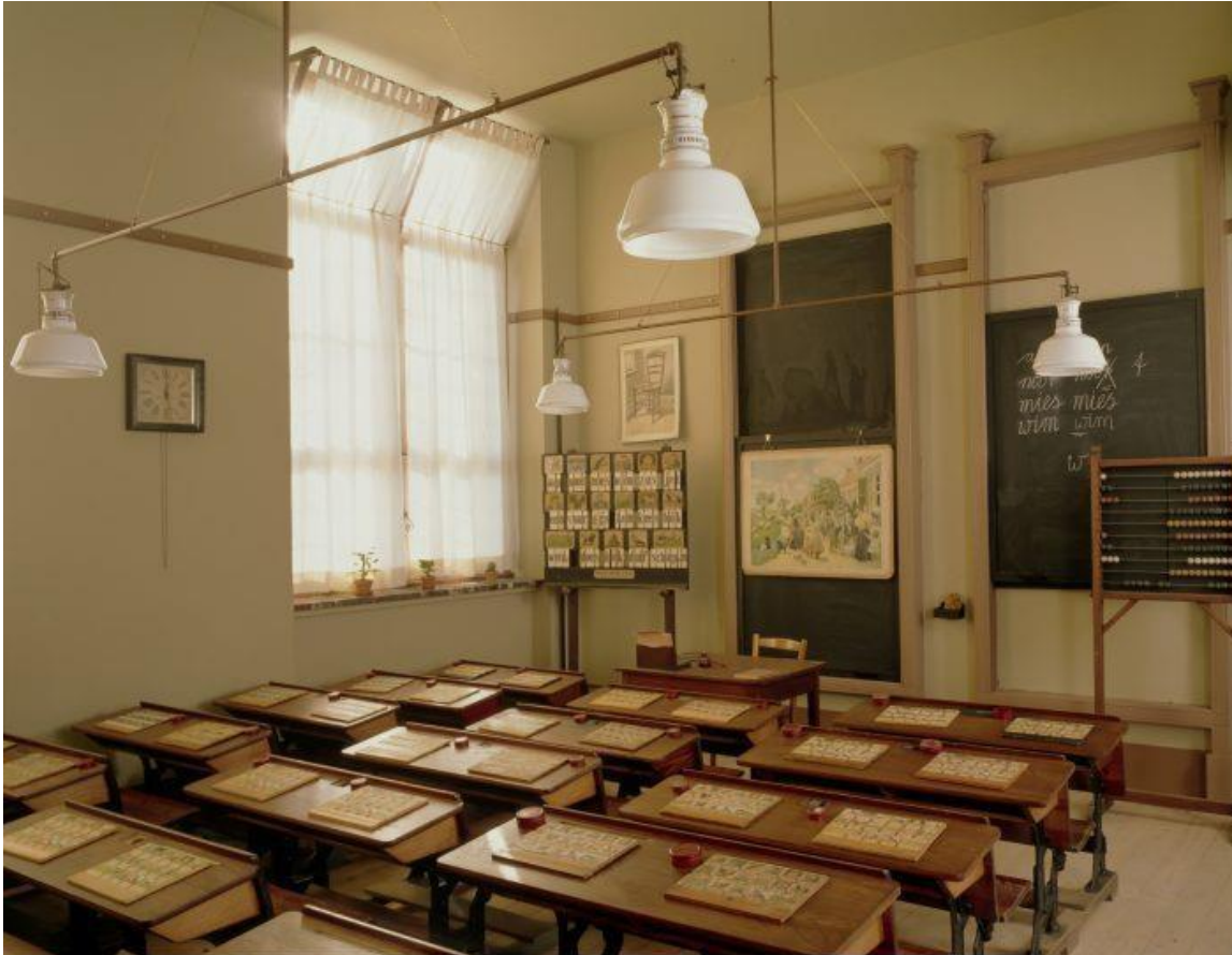
Klaslokaal omstreeks 1910

Ga naar aanleiding van de besproken stellingen nog kort met de kinderen in gesprek. Wat vinden ze van de school van vroeger? Wat is het grootste verschil met de school van nu? Wat vinden ze ervan dat jongens en meisjes vroeger aparte vakken kregen? En wat zouden ze ervan vinden als juffen of meesters bij straf nog steeds zouden mogen slaan?