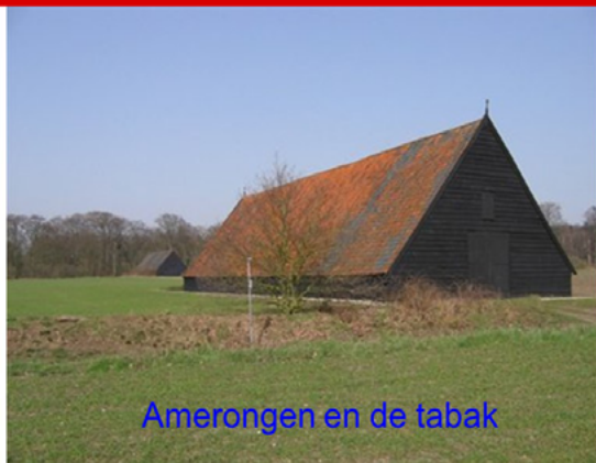
Amerongen, Veenendaal, tabak en industrie

Landbouw en veeteelt zijn op de Utrechtse Heuvelrug altijd nauw met elkaar verbonden geweest. Er werd rogge, boekweit, haver, tarwe en gerst verbouwd en vanaf eind 18de eeuw ook aardappelen. Om de onvruchtbare zand- en heidegronden herhaaldelijk te kunnen bewerken was veel mest nodig.